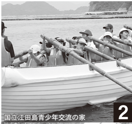
国立江田島青少年交流の家

1日目に、野外活動での危険予知・回避方法などを学んだ。第6回の三瓶でやる雪遊びプログラムをみんなで企画した後、夜遅くまで「自立」について考えた。2日目は三倉岳登山。予想以上に険しかったけど、「自分の身は自分で守る」昨日学んだ成果を見せられたよ。