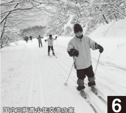
国立三瓶青少年交流の家

高校生リーダーによる講演の後、みんなでリーダーとは何か考えてみた。火を起し、みんなで作ったカレーは絶品だ。2日目。全員の呼吸が合い、カッターが進んだ時は感動したな。2回しか会ったことないけど、俺たち仲間だね。