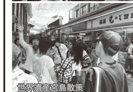
世界遺産宮島散策