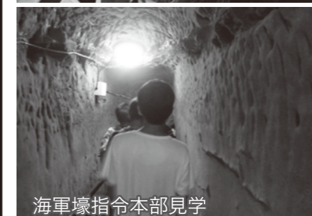
海軍壕指令本部見学