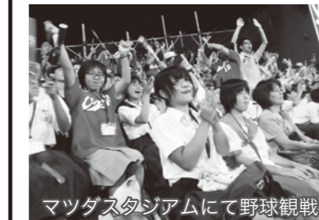
マツダスタジアムにて野球観戦