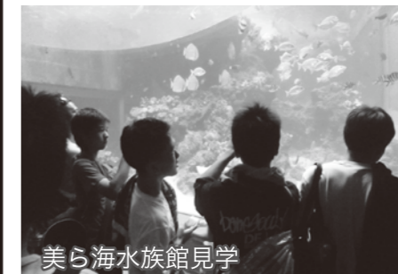
美ら海水族館見学