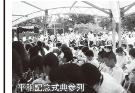
平和記念式典参列