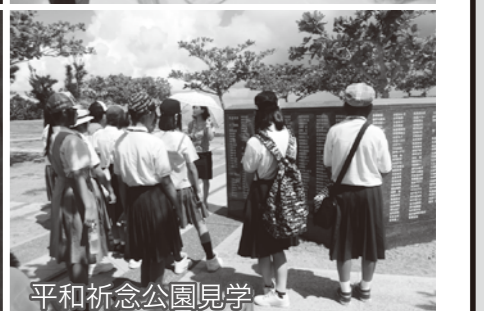
平和祈念公園見学