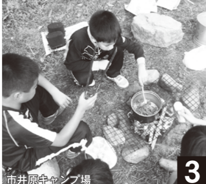
市井原守キャンプ場

一面の銀世界を、歩くスキーで体験。かまくらを作ったり雪合戦をしたり。大竹にもこれくらい雪があったらな……。企画会議では自分の意見を出せた。次回はみんなで企画したプログラム。絶対に成功させたい。