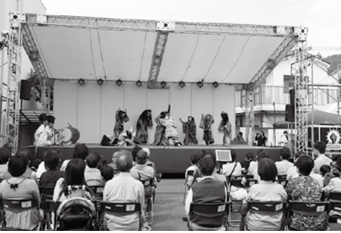
【下】北中山こども神楽の力強い舞に観客は魅了された。