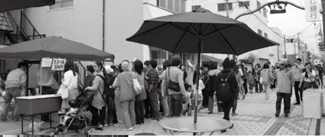
【上】郷土料理「もぶり飯」に長蛇の列。