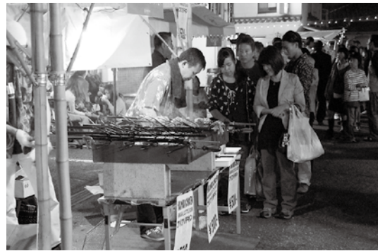
来場者は思い思いに名店をめぐり、絶品グルメを味わった。