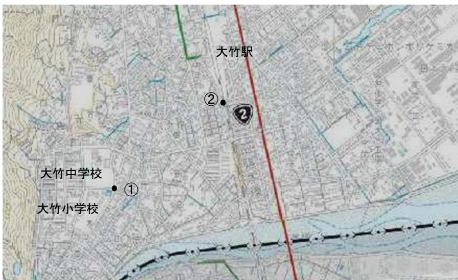
①対策前(陸橋の異なる段差部)