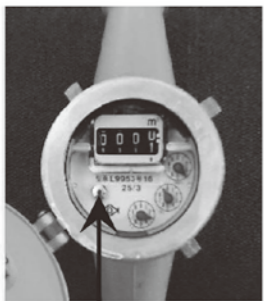
水道メーターのパイロットマーク（羽根車）通水時は回転します。

このビジョンに基づいて、経費の節減や料金設定の検討を行い、経営の健全化を図りながら、計画的な老朽化施設の改築更新や耐震化を進め、ビジョンの基本理念である「いつでも安全で安定した水の供給」の実現に向けて取り組んでいきます。 「大竹市水道ビジョン」は、市ホームページに掲載しています。