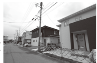
サザンビレッジの街並み。新築中の家もあります。