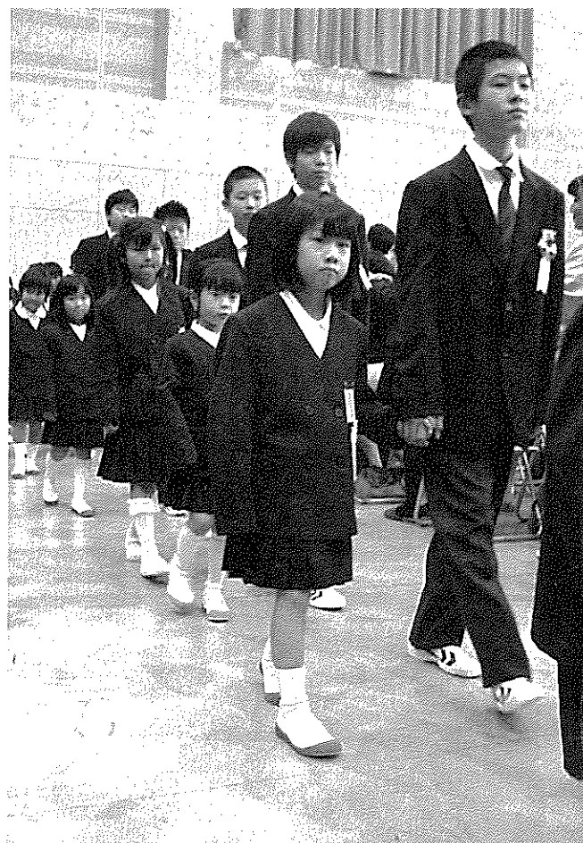
(上) 新小学1年生と中学1年生が手をつなぎ、たくさんの拍手の中を入場。