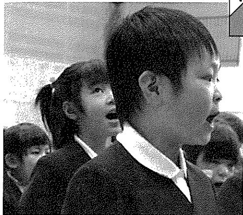
(右) 元気よく「一年生になったら」を歌う。