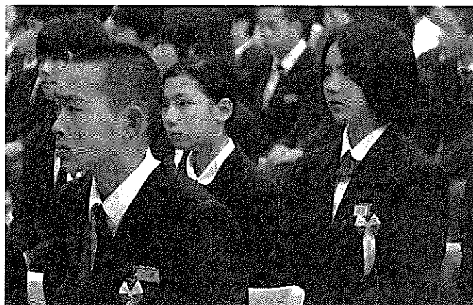
(左) 校長先生の式辞を真剣に聞く。