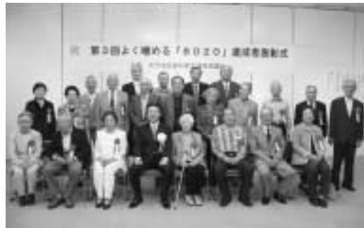
昨年の表彰式の様子

よく噛める ハチマルニマル 「8020」達成者募集 大竹地区歯科衛生生連絡協議会 (社会健康課内) ☎2140