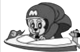
ボートレース宮島マスコットキャラクター「モンタ」