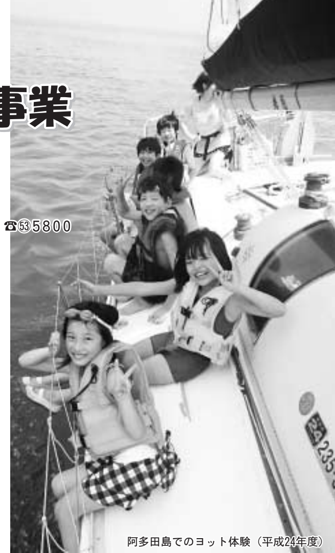
阿多田島でのヨット体験（平成24年度）

申し込み 4月30日(火)までに生涯学習課へ、電話、ファクス、またはメールで、名前、学校名、学年、性別、住所を連絡してください。電話の受け付けは、土・日曜日、祝日を除く8時30分～17時15分です。 ○ファクス ☎5801 ○メールアドレス seigaku@fch.ne.jp 募集説明会 4月21日(日) 10時～11時 ところ 総合市民会館 ※ 参加者が定員を超えた場合は選考を行います。