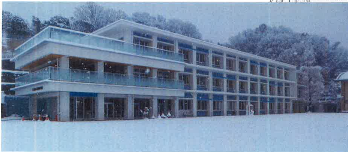
(南面全景1月15日現在)