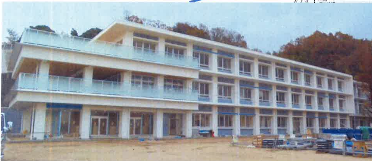
(南面全景12月15日現在)