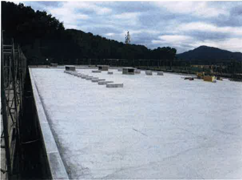
(屋上全景9月20日現在)