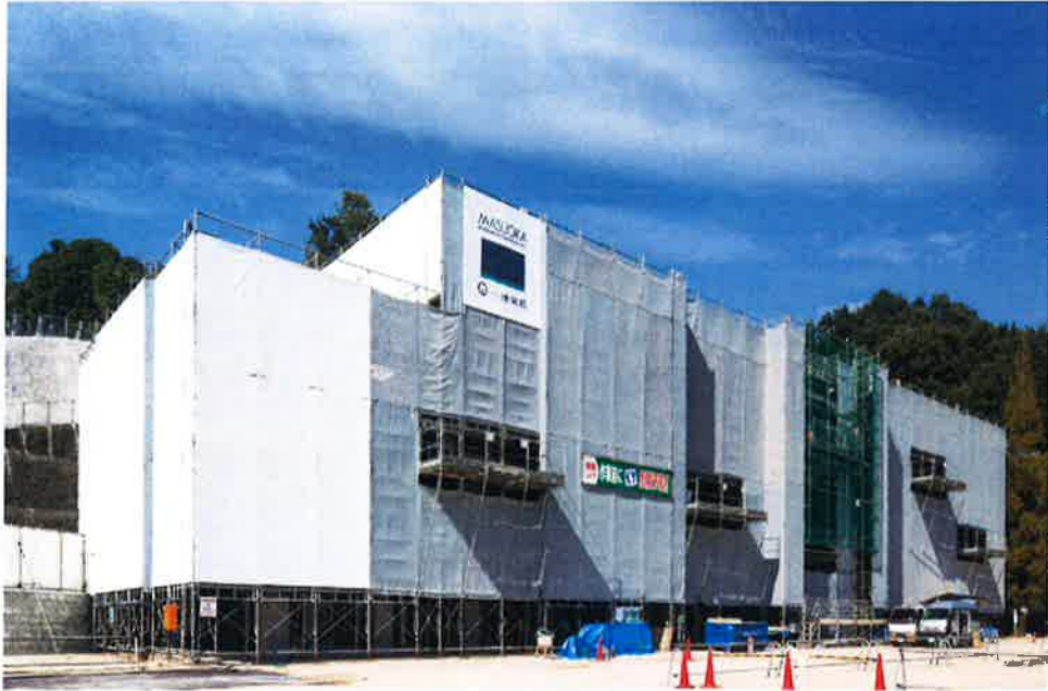
( 全景10月15日現在 )